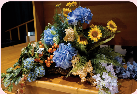
"La natura dell'Alberti" Auditorium a.s 2021 - 2022

Chissa quali idee saranno nascoste dentro questo vaso...