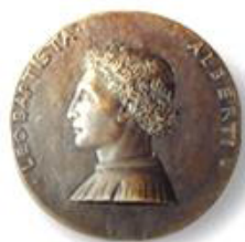
Liceo Scientifico Statale L.B. Alberti Minturno LT