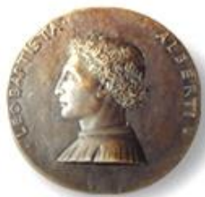
Liceo Scientifico Statale L.B. Alberti Minturno LT